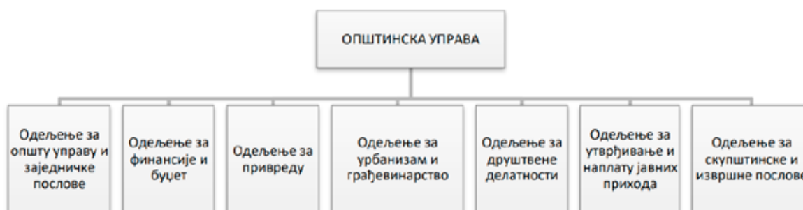
Слика 1. Шема организационе структуре Општинске управе Бачка Паланка

Помоћници Председника општине (за област заштите животне средине, за област економског развоја и урбанизма и за област развоја месних заједница) прате, покрећу иницијативе, предлажу пројекте и сачињавају мишљења у вези са питањима која су од значаја за област за коју су задужени.