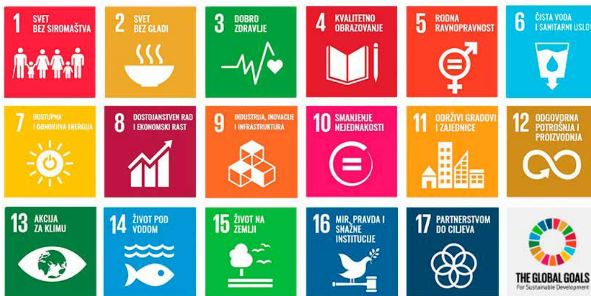
Прилог 6. Циљеви Агенде УН за одрживи развој 2030

Глобални компакт о сигурним, уређеним и регуларним миграцијама - Глобални компакт (GCM) представља међународни стратешки документ са веома широко постављеним приступом како би се заједничким приступом међународне заједнице оснажиле могућности за постизање различитих циљева ради побољшања положаја становништва на целој планети, заштити свих елемената природе и живота на свим кон-