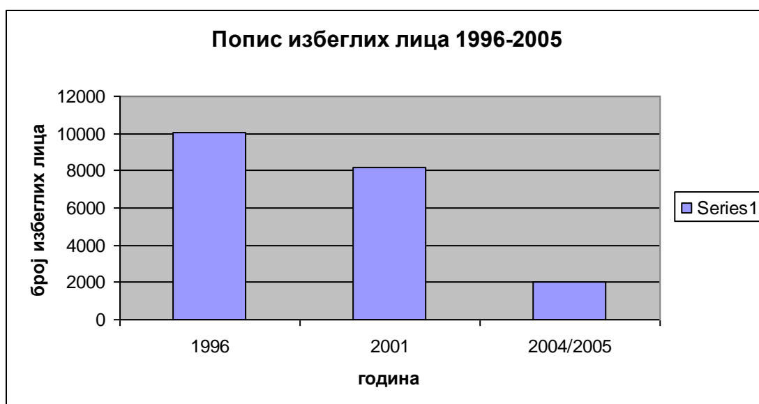
Прилог бр. 5 - Полна структура избеглих лица на територији Општине Бачка Паланка у периоду 1996-2005