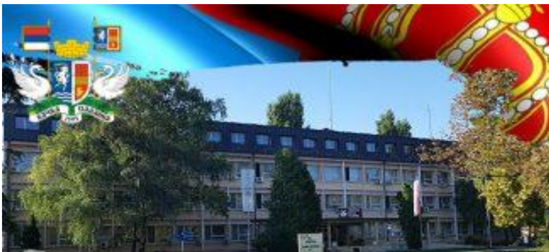
Локални акциони план за управљање миграцијама на територији општине Бачка Паланка за период 2024.-2028.